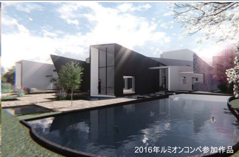
2016年ルミオンコンペ参加作品