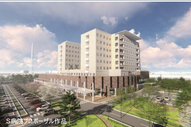
S病院プロポーザル作品